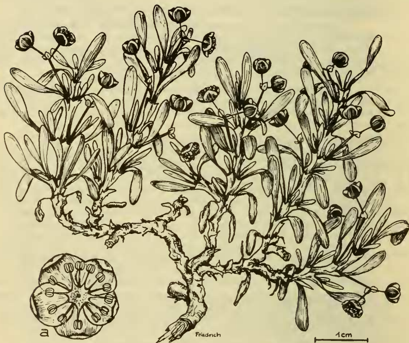
Hypertelis angrae-pequenae Friedr. Habitus nat. Gr. a. Blüte ausgebreitet, 5 x

der damaligen Neubeschreibung nicht darauf geachtet, daß die Blütenhülle an der Basis zu einem kurzen Becher verwachsen ist.